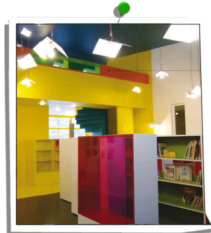
La bibliothèque, après rénovation

Entre 2009 et 2013, 440 élèves et les enseignants de 5 établissements scolaires publics élémentaires ou primaires ont participé à la rénovation de leur école accompagnés par 5 designers et 1 architecte. Des espaces de circulation (couloirs et escaliers), une bibliothèque, une salle de restauration ainsi qu'une cour et son préau ont ainsi été rénovés dans le cadre de ce programme.